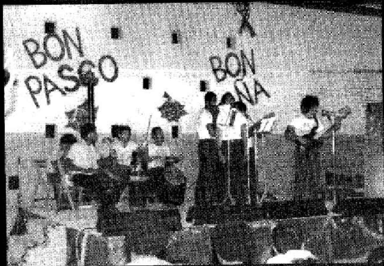
Ambiente na Nochi Navideño, den añanan ochenta...